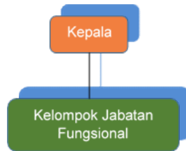
Gambar 1. Struktur Organisasi Loka POM

Adapun di Provinsi Jawa Tengah, terdapat 3 (tiga) UPT Badan POM antara lain Balai Besar POM di Semarang, Loka POM di Kota Surakarta, dan Loka POM di Kabupaten Banyumas. Loka POM di Kabupaten Banyumas memiliki struktur organisasi seperti Gambar 1.1 berikut: