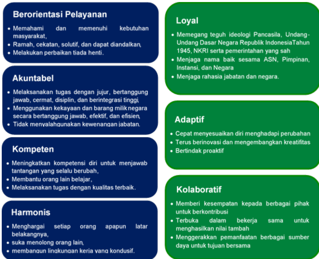
Gambar 3. Core Value ASN BerAKHLAK